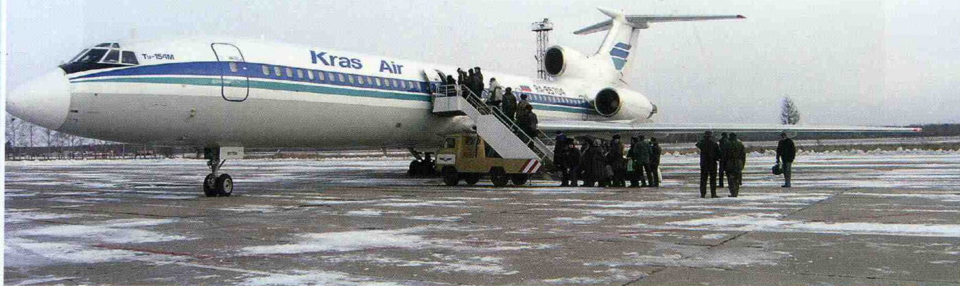
Отправка рейса ТУ-154.