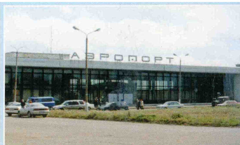
Старое здание вокзала 1964-1974 гг.